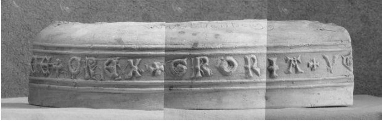
NH Kerk Woudenberg, opschrift luidklok