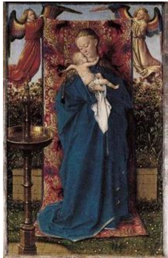
Madonna bij de fontein Jan van Eyck, 1439

De bronzen fontein, links vooraan, stelt de Moeder Gods als levensschenkende bron voor.